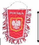
PROPORCZYK FRĘDZLE Wzór ogólnopolski.