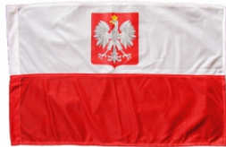
FLAGA 100x140 DUŻA Flaga z godłem.