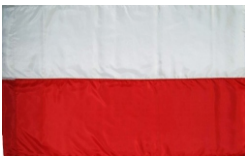
FLAGA 95/150 Flaga bez nadruku.