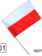
FLAGA 27x41 MAŁA Flaga na kijku.