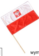
FLAGA 27x41 MAŁA Flaga z godłem na kijku.