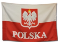
FLAGA 60/90 PL Flaga Polski z godłem i napisem Polska lub bez nadruku.