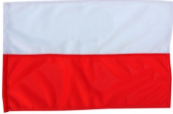
FLAGA 100x140 DUŻA