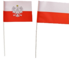
CHORĄGIEWKA PAPIEROWA Papierowa chorągiewka na patyku. Wzór: Flaga Polski i Flaga Polski z Orłem.