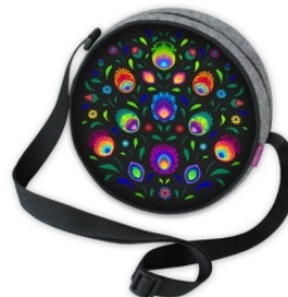
TOREBKA TWIST OBEREK Torba wykonana z filcu, o średnicy ok. 20 cm.