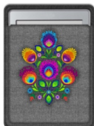
ETUI NA E-BOOK JAGNA Filcowe etui na ebook w rozmiarze 145 x 200 mm.