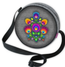
TOREBKA TWIST JAGNA Torba wykonana z filcu, o średnicy ok. 20 cm.