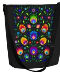
TOREBKA FUNKY OBEREK Torba wykonana z filcu, mieści format A4.