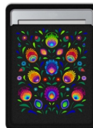
ETUI NA E-BOOK OBEREK Filcowe etui na ebook w rozmiarze 145 x 200 mm.