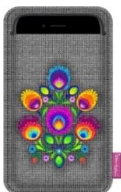
ETUI NA SMARTPHONE JAGNA Filcowe etui na smartfon o wymiarach: 100 x 175 mm.