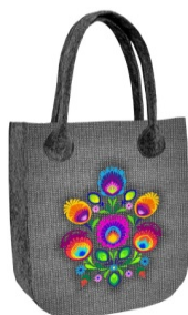
TOREBKA CITY JAGNA Torba wykonana z filcu, mieści format A4.