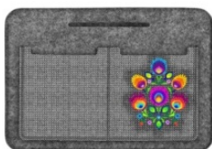
ORGANIZER PREMIUM JAGNA Organizer filcowy do torebki.