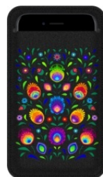
ETUI NA SMARTPHONE OBEREK Filcowe etui na smartfon o wymiarach: 100 x 175 mm.