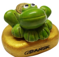
FIGURKA MS Ceramiczna żaba z groszem na szczęście.