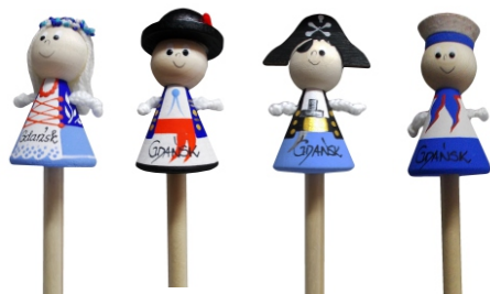
OŁÓWEK LALKA LUD. Ołówek zakończony drewnianą laleczką.