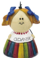
LALKA CER DZW MIASTA Dzwonek w kształcie laleczki.