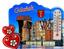
MAGNES TER. Magnes z termometrem.