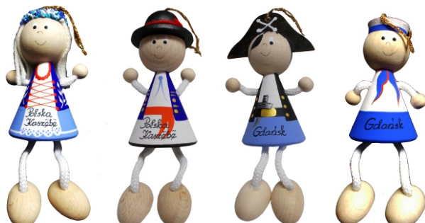
LALKA DREWNIANA LUD. Drewniana laleczka z zawieszka.