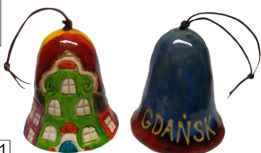
DZWONEK MIASTO Kolorowy ceramiczny dzwonek. Różne miasta.