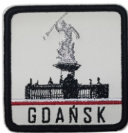
MAGNES EMBLEMAT HAFT MIASTO Magnes haftowany z możliwością przerobienia na przyprasowanąkę.