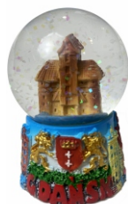
KULA 4,5 CM GDAŃSK Kula śnieżna z motywem gdańskim.