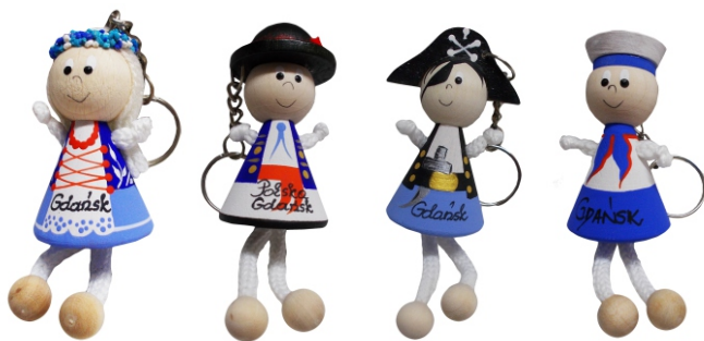
BRELOK LALKA LUD. Brelok z drewnianą laleczką w stroju ludowym.