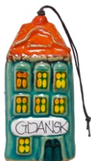
KAMIENICZKA CER DZW MIASTA Dzwonek w kształcie kamieniczki.