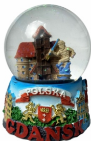
KULA 6,5 CM GDAŃSK Kula śnieżna motywem gdańskim.