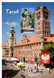
FOTO MAGNES MIĘKKI