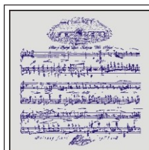
3. Chopin Nuty A. Szara B. Granatowa