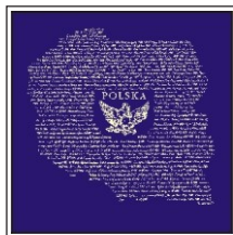
5. Polska daty