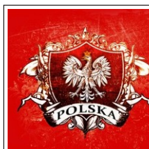
101. Polska królewska a. czerwone tło b. czarne tło