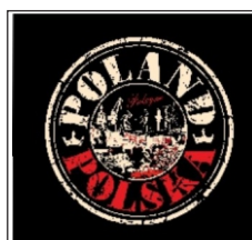
153. Polska okrągły