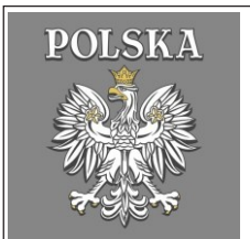
162. Orzeł puchnący kontur