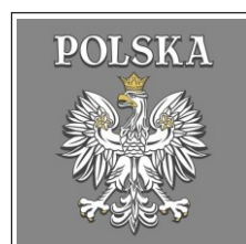
162. Orzeł puchnący kontur