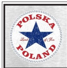
125. Land of fun Kolory koszulek: czarna, czerwona, szara.