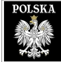
135. Orzeł puchnący kontur A. Mały B. Duży