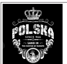
168. MGM Polska