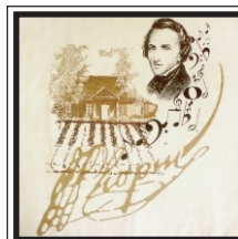
100. Chopin dworek