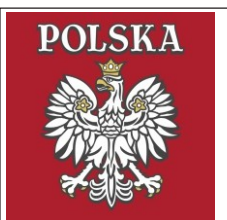
134. Orzeł puchnący kontur w wersji damskiej B. Duży