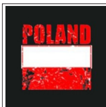
102. Flaga Polska