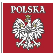
134. Orzeł puchnący kontur w wersji damskiej B. Duży